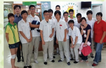
校外參訪活動一博正兒童發展中心