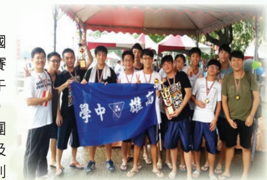
本校學生勇奪自力環保造筏佳績，李副市長親臨打氣加油

高雄市教育局第 7 屆「全民國防教育 - 自力環保造筏瀾英雄」競賽活動，於 7 月 19 日 (星期六) 上午 10 點於蓮池潭艇庫碼頭點燃戰火，由學生、教師、家長及民間企業團體總計超過 70 隊參加，以環保及創意為主題，必須發揮巧思創意利用廢棄物製作可搭乘 6 人的環保船筏，宣導科學技術、全民國防及體育、防制藥物濫用等。本校同學製作的潛艇、戰艦造型的船筏特別吸睛，引來記者圍繞不斷閃快門。副市長李永得特地前來打氣，說：「我也是雄中校友，你們一定要得第一喔！」經過一整天的激烈競逐，本校果然不負眾望，勇奪高中職組第一名和第四名的殊榮。