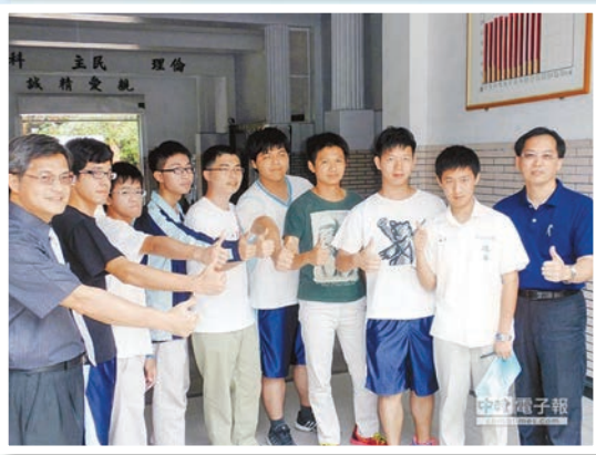
本校 102 學年度升大學績效亮眼