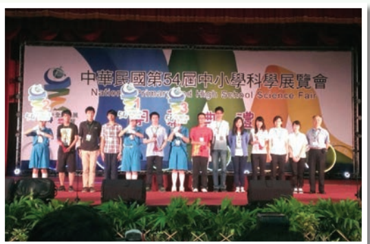
本校學生參加全國科展成果豐碩