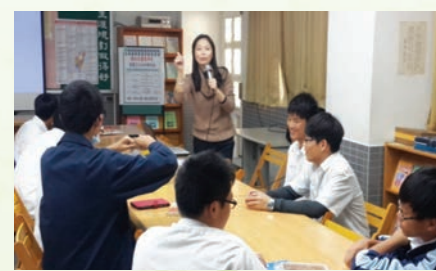
護理師於學友制課程講授身體病弱學生之特殊需求

學友制，係本校每年透過有意願之高一普通班學生提出報名後，以特殊需求學生所在班級之同儕為優先，經本校特殊教育資源教室甄選並完成特殊教育專業知識訓練，再依學友之專長、特質，妥適為個別特殊需求學生安排服務時段及服務方式，服務類型多元及彈性，共計四大類，包括：空間無障礙 (服務類)、心理無障礙 (活動類)、學習無障礙 (學藝類) 及資訊無障礙 (編輯類)。本校自民國 97 年成立第一屆資源教室學友制後，開始從普通班各班招募學友志工至今已達第七屆。第一屆至第六屆完成訓練並獲取學友證書的學友累計達 110 名，其直接或間接服務校內特殊需求學生累計達 86 名，單以 102 學年第二學期為例，第四至第六屆學友即提供 417 小時的服務量。相關課程訓練，除介紹特殊教育各類學生的特質和需求外，並提供相關輔導和醫護領域課程，歷屆學友制所曾邀請的講師除特殊教育教師，另包括本校輔導教師、護理師及治療師等，部分輔導教師同時具心理師證照，講師群背景符合特殊教育所要求「相關專業團隊整合」之精神。除了專業課程訓練外，同時安排實務討論及校外參訪活動。