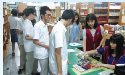
圖書館家長志工服務同學