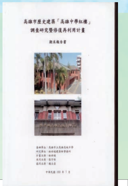
紅樓調查研究暨修復再利用計畫書

小組，辦理多次調查研究暨修復計畫採購評選委員會會議，審查本校紅樓調查研究暨修復計畫書。103 年 5 月 15 日完成「紅樓調查研究暨修復再利用計畫」期中報告書審查，103 年 8 月 22 日召開「紅樓調查研究暨修復再利用計畫」期末報告書審查。此案為本校紅樓的歷史淵源、建築特色、保護計畫、利用價值留下最珍貴的研究資料。