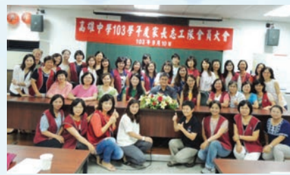
103 學年度家長志工大會