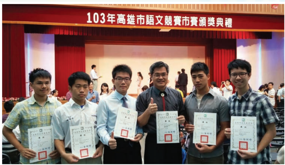
本校參加高雄市 103 年度語文競賽榮獲高中職團體組特優