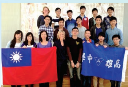
本校師生訪問丹麥格雷沃高中，完成一趟精彩的學習及國民外交之旅

今年 2 月，在高雄市政府教育局王進森副局長與外交部南部辦事處蕭勝中副處長見證下，本校與丹麥格雷沃高中 (Greve Gymnasium) 簽署姐妹校。8 月 16 日至 27 日，由英文科張莉琳、陳景鴻兩位老師帶領 15 位同學師生赴丹麥與姊妹校格雷沃高中進行交流學習活動，師生一行 17 人經過長途飛行，終於抵達北歐幸福的國度。很快見到了格雷沃高中新任校長 Mette Trangbaek Hammer，全體師生除轉達了本校祝賀之意，並代表謝校長致贈精美的法藍瓷見面禮，同時歡迎 Mette 校長能抽空到台灣及本校訪問。Mette 校長很感激本校的祝賀，更喜歡謝校長贈送的禮物，也答應將來若時間許可會到本校參訪。前往交流的學生出發前積極準備學校簡介報告與文化表演，讓丹麥師生能夠更加瞭解我們的學校生活。活動期間，本校學生不但體驗了不同的教育方式與理念，也拜訪了駐丹麥臺北代表處、國會以及樂高樂園等著名景點。