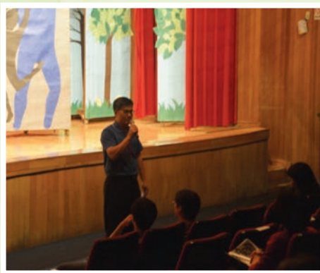
科學班舉辦年度成果發表會，吸引全國各地高中科學菁英前來觀摩