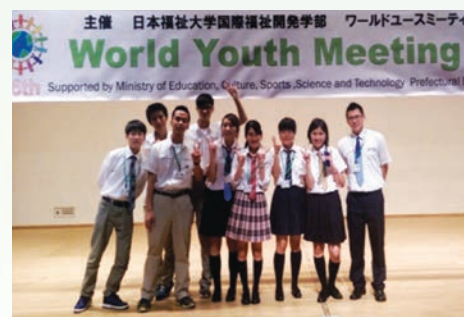
本校學生參加日本 WYM 活動表現極佳

自 1999 年第一屆世界青少年會議 (World Youth Meeting) 舉辦以來，迄今邁入第 15 個年頭。今年 8 月 3 日至 10 日，包含三位雄中學生在內，高雄市中職暨大專院校共 42 名學生前往日本與會。今年會議主題為「快樂的元素」(Ingredients of Happiness)。本校學生、高雄高工學生與立命館中學學生共同討論、製作專題並於大會上發表，最終獲得「金獎」的佳績。除了專題發表外，學生也參觀京都著名的清水寺，並體驗當地文化。