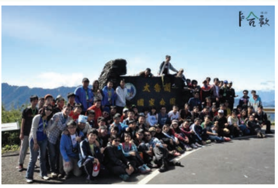
科學班辦理野外深度生態研習