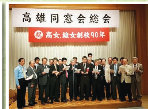
全體校友合唱雄中校歌