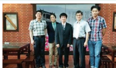
台日雙方達成交流活動協議