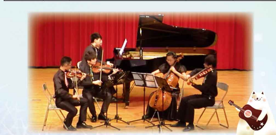
103 年全國學生音樂比賽高雄市初賽本校表現優異