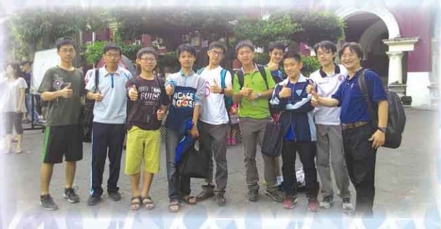
103 學年度全國南區英文單字競賽，本校榮獲佳績。