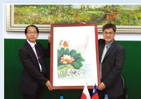
謝校長致贈西立野校長精細的彩墨畫