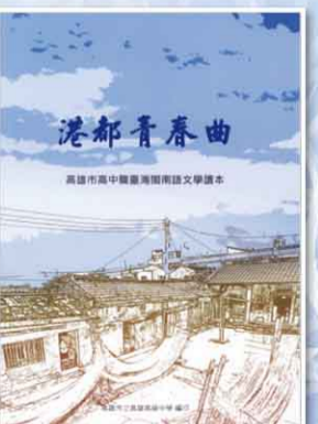
《港都青春曲》台語文學讀本書影