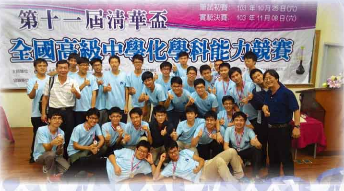
第 11 屆清華盃全國高級中學化學能力競賽，本校表現優異。