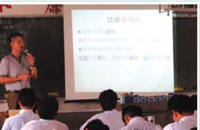
特教老師至班級宣導

5. 特教業務除了針對有特殊需求的學生外，也會至各班實施特教宣導，讓同學能更瞭解特教知識，另外，更有學友志工的課程，讓有興趣的同學能獲悉各類特殊種類與需求。同學們在參與特教宣導時都很認真聆聽，甚至還會做筆記，培養同學的專業知識和同理心，讓學習環境更加友善。