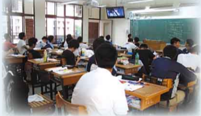
性別平等教育週影片欣賞

3. 輔導室於週會時間播放「16 歲，那年」廣受好評，同學都相當投入並參與討論。「16 歲，那年」除了是校園青春短片外，劇中也提及了心理健康問題、親子溝通、親密關係的萌芽與相處...等，更貼近學生生活，也能夠讓同學去思考與討論，更有各班導師帶領同學一同分析和分享心得。