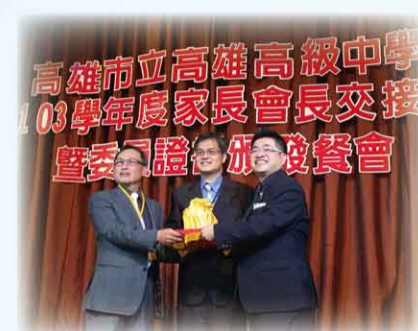
2014.11.02 103 學年度家長會長交接典禮

睽違三十載之後，又因緣際會回到紅樓。之前是聆聽師訓，孜孜矻矻；此番則是心懷感恩，回饋母校。猶記得當時理著平頭、穿著制服，於旭日朝暉中聆聽師長們的訓勉；在課室中，沐浴於老師的諄諄教導；在操場、球場上，奮力揮灑青春的汗水。回想起一幕幕的往事，鮮活的在眼前閃爍，令人不禁又热血沸腾起來，好想能再年輕一次。