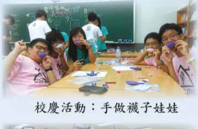
校慶活動：手做襪子娃娃

2. 輔導室在運動會舉辦「套住你的心—襪娃娃 DIY」活動，同學報名踴躍，當天大家都成功縫製襪娃娃，並增添創意，替自己縫製獨一無二的手做娃娃。