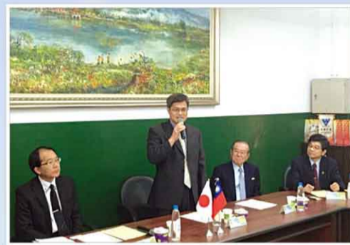
謝校長代表全校師生致歡迎詞