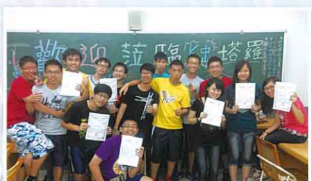
雄中塔羅社輔導志工開心 show 出證書

6. 雄中與雄女塔羅社同學運用塔羅牌當作工具，定期在校內為同學提供服務。校慶當天舉行了資格考試，確保兩校社員們擁有足夠的輔導與塔羅知能，最重要的是保密觀念的教導與釐清，以保障每個求助者的權益。除了每週二、五中午之外，萬聖節與聖誕節也都有相關的系列活動，頗受雄中女同學的好評。