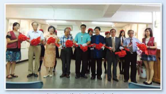
畫展開幕典禮貴賓剪綵