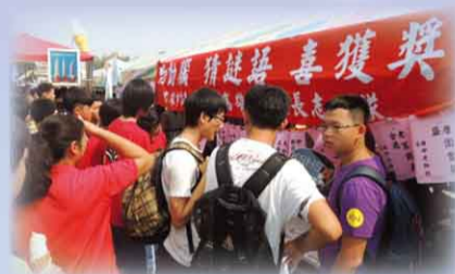
同學們踴躍參與猜謎

4. 配合本校 103 學年度全校運動會園遊會活動，圖書館結合家長志工隊特地設置「動動腦猜謎喜獲獎」攤位，邀請高雄市長謝文斌、市長徐添河先生，以本校教職員工姓名及校園建築場景製作 300 道謎面，家長志工大方捐錢購買獎品，鼓勵全校師生多多動腦猜謎並藉此認識校園點滴。