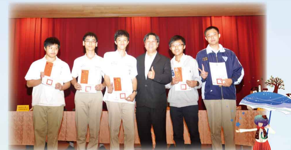
103 學年度高雄市數學自然學科能力競賽，本校表現優異。