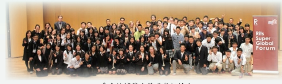
參與論壇學生展現年輕活力