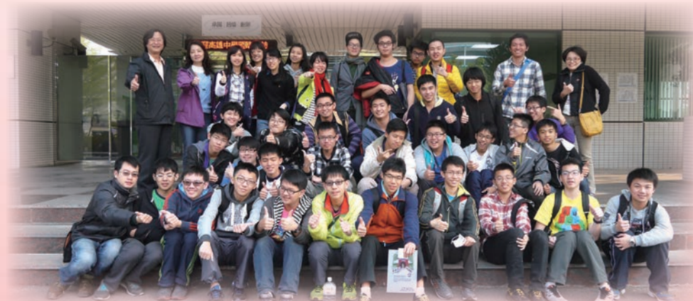
國研院動物實驗中心，讓學生了解相關生物醫學科技運用在日常生活。

本次活動目的主要是讓學生走出戶外，體驗台灣自然生態之美，並且訓練學生對自然的觀察能力，進而培養團隊合作的精神；同時精進學生科學相關知識，進而應用至未來的專題研究。