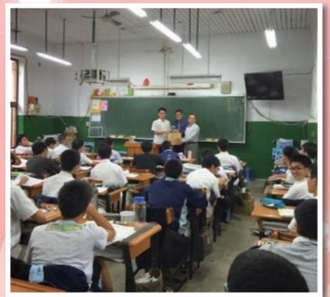
校長及家長會長致贈本校高三學生考試幸運筆，在場學生感受到學校的用心與來自家長的愛心

儀式完成後，回學校，與宋會長一同到每個高三班級分送經加持過的2B鉛筆及狀元餅，並勉勵同學除了「天助」之外，也要「自助」，要把握學測前的時間，全力衝刺，預祝同學學測高分，金榜題名。