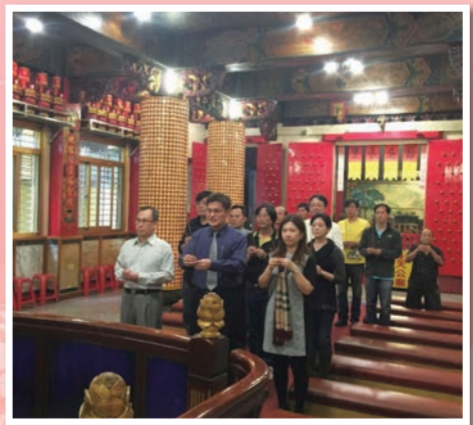
校長及家長會偕同本校教職同仁前往玉皇宮誠摯禱告，祈求學生考試順利