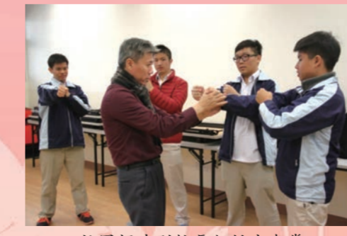
社團課陳副校長親授永春拳