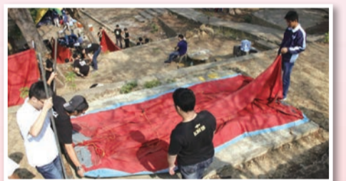
到達活動場地後，攝影師從這個角度看過去，同學們正揮汗搭著帳篷，彼此之間有著合作無間的默契，除此之外，營地高高低低，飽富野趣。

1. 104年3月5、6日，雄中雄女在暖暖的三月天中辦理聯合公民訓練活動，本次活動距離民國74年第一屆辦理活動，今年活動已屆三十週年，所有的活動都在氣氛融洽的小隊聯誼、晚會、大地遊戲中逐一進行。活動前必須由各班的活動總召抽出對班的班級，之後配合大隊表演練習舞步、排練活動。