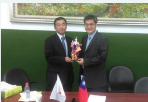
大竹老師致贈日本風俗物予謝校長