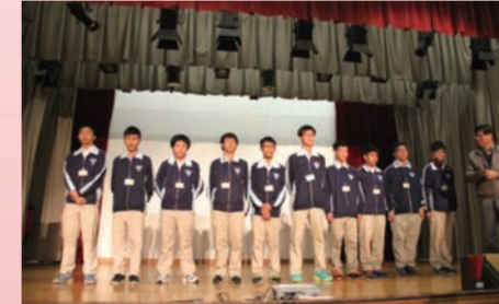
參加優才書院全校朝會