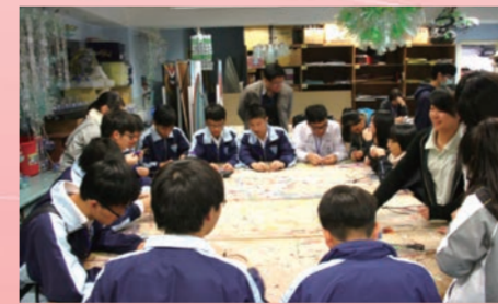
參加優才書院分組討論