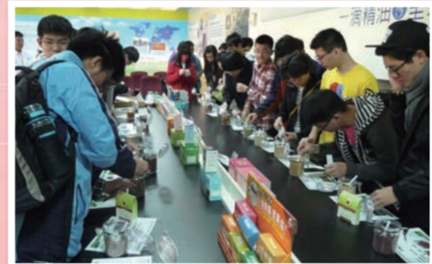
港香蘭生技公司，了解日常生活科學藥物並提供天然食材讓學生 DIY 茶包。