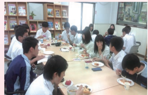
大宮學生大啖台灣風味美食