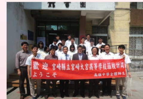
圖書館前相約今年九月再見