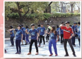
晚會活動前，各班無不奮力練習，為爭取最佳小隊的佳績努力進行彩排。