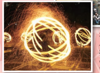
中心廣場營火晚會現場，由雙繩索構成的火球舞，舞動了青春的心，也帶來現場一陣陣的讚嘆和掌聲。