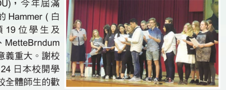
開學始業式上歡迎丹麥友人

活動期間，丹麥學生除了到國立海洋生物博物館以及高雄旗津觀光、體驗台灣特殊的風俗民情外，也安排隨班學習、社團活動、彩繪燈籠、國樂欣賞及體育活動。至於 Hammer 校長、兩位教師和本校學生對談、交流教育經驗與想法以及與本校自然科教師座談，以瞭解彼此之課程規劃與教學方式，都是很棒的交流方式。