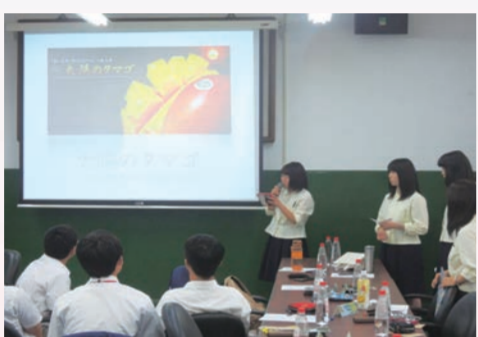
大宮高校學生簡報日常作息