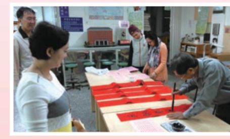
氣韻甜美的文字蘊含滿滿的福氣吉祥