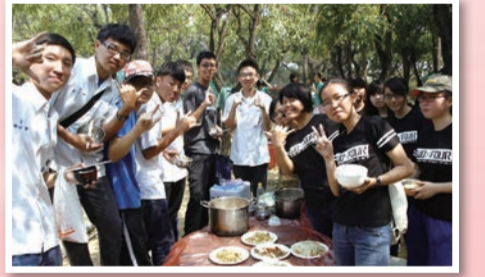
到達營地之後的第一餐，看大家所煮的食物裝盤之後，色彩繽紛，小隊員之間笑容可掬，這一餐吃起來特別有滋味呢！

歷年來活動的高潮都在營火晚會的時間，分別由學聯會辦理的和平廣場、童軍社辦理的中心廣場，以及康輔社辦理的忠孝廣場分三場，同一時間舉行。個廣場的活動內容和節目安排各有特色，也各擅勝場。穿插拜火、火球、火棍等精彩刺激演出；之間也穿插短劇、帶動唱、大隊表演等活動，多采多姿，令人難忘。也展現雄中雄女學生在課業壓力之餘，釋放青春輕鬆活潑的一面。