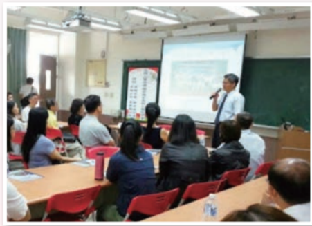
校長向鳳西國中家長及學生宣導，在座家長均專心聆聽。

103 年度，12 年國教第一年實施開始，雄中雄女同赴高屏地區重點國中宣導，鼓勵同學勇敢設定目標，向雄中雄女敲門。去年校長宣傳二十幾所學校，104 年 4 月 11 日上午校長來到鳳西國中，進行雄中入學宣導第 15 場。感謝鳳西國中團隊的用心辦理、家長的熱情參與及專注。