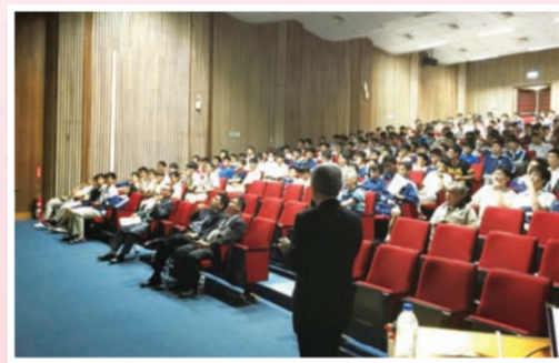
張教授發表講座，在座都是高三的學生，目光專注的聆聽教授的講座。

2. 104年3月31日高雄醫學大學名譽教授，同時擔任財團法人台灣肝臟學術文教基金會董事長的張文字教授至本校發表傑出校友講座，講座中提到在雄中求學點滴以及雄中過去的景致。張教授為醫療奉獻獎得主，非但將畢生所學投注於國人之肝病醫療服務上，現更將觸角延伸至社區，帶領著基金會成員後輩，全心投入照顧高雄地區民眾的身體健康，並於國內相關醫學會中擔任理監事等要職，持續貢獻其寶貴經驗，盡心盡力，亦為高醫樹立良好形象，並獲優良口碑，堪稱服務楷模在座學生也針對張教授的研究和求學過程詳細提問。