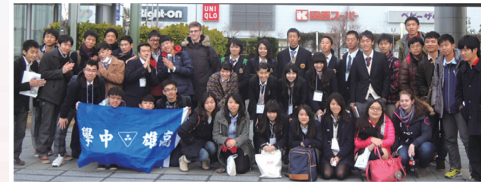
參觀兵庫縣地震研究中心