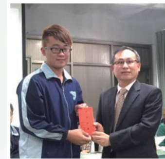
家長會於104年1月22日，在教官室的協助下舉辦了『仁愛基金同學春節慰問金發放』，讓這些同學過好年。