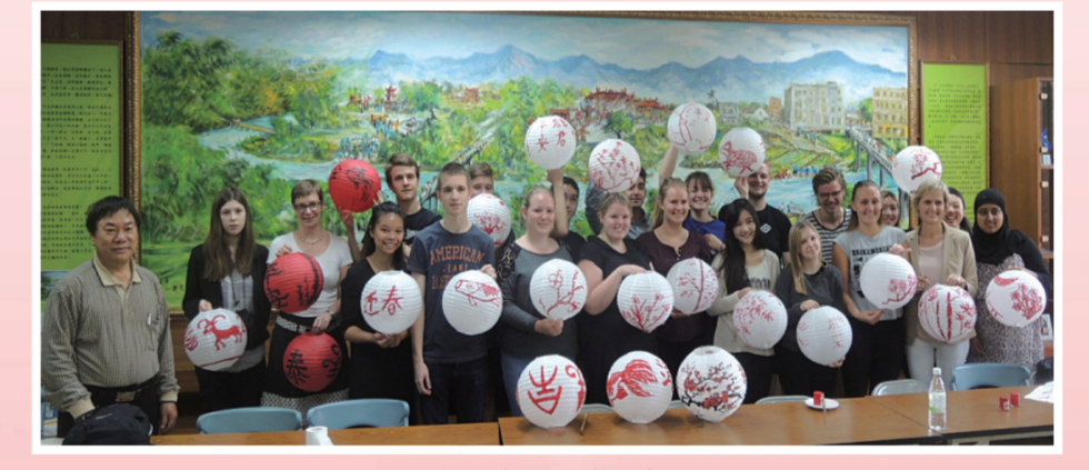
彩繪燈籠課後展現成果