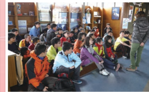
黑面琵鷺解說中心，瞭解保育類生物相關習性