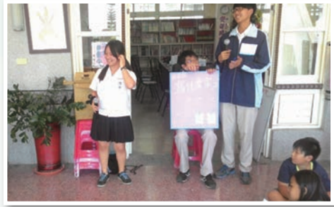
本校同學與當地學童在充滿現代感與原民風布置的校園中，進行英語對話與分組活動